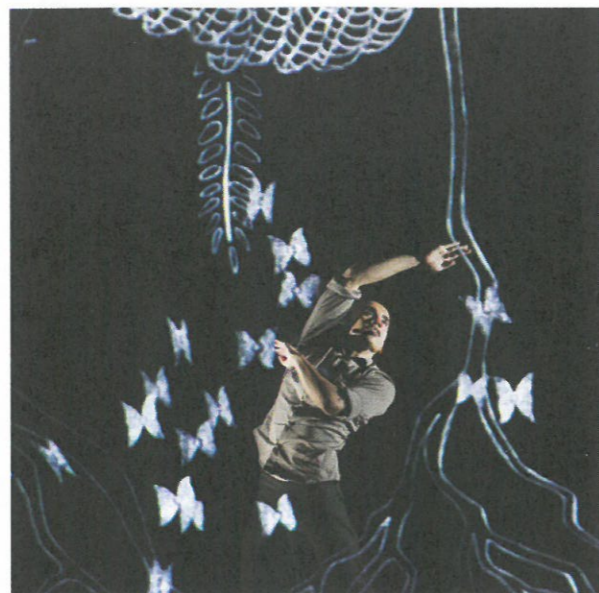
► Plonger dans l'enfance avec le chorégraphe Akram Khan.