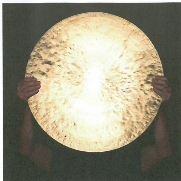
► Découvrir l'œuvre de Stéphane Thidet à l'abbaye de Maubuisson.