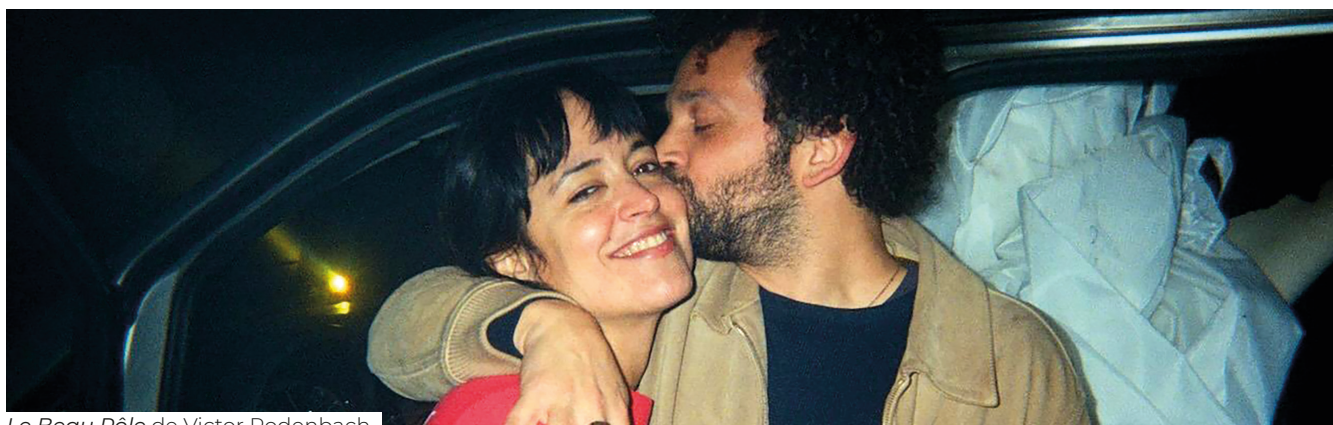
Le Beau Rôle de Victor Rodenbach