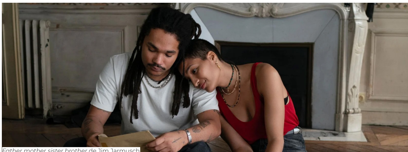
Father mother sister brother de Jim Jarmusch