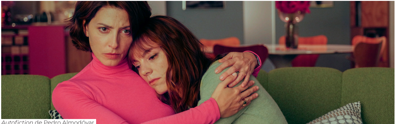
Autofiction de Pedro Almodóvar