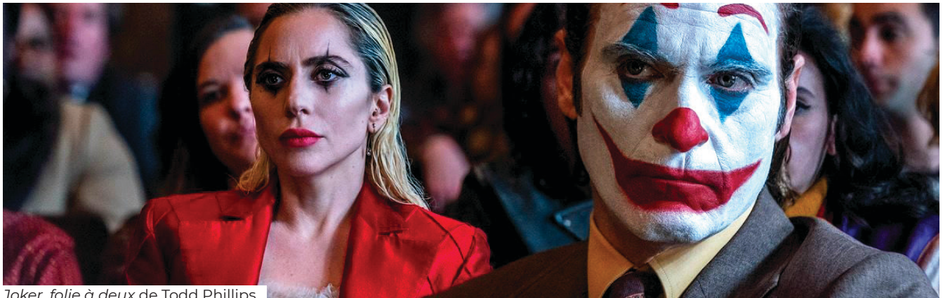
Joker, folie à deux de Todd Phillips